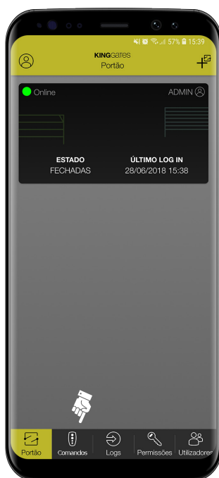
1- Clique no tópico (comandos)