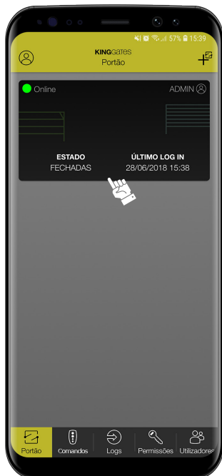
1- Clique no retângulo preto