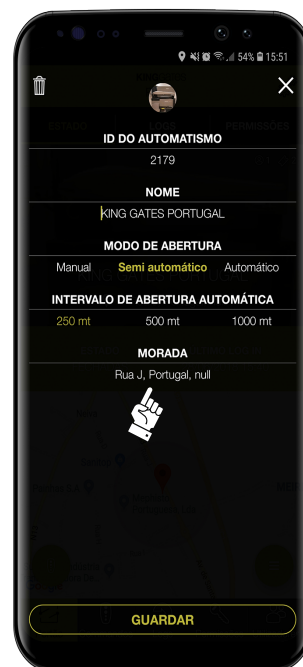
3- Personalize todos os passos presentes no retângulo. Coloque a sua morada manualmente para uma melhor localização.