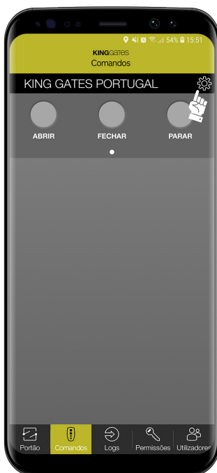
2- Clique no icon das definições