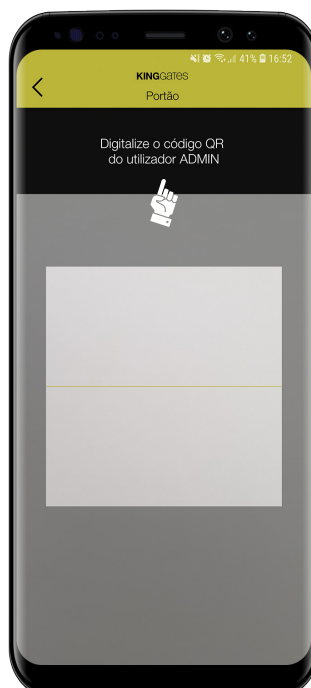
3- Faça o Q.R. CODE criado pelo Administrador