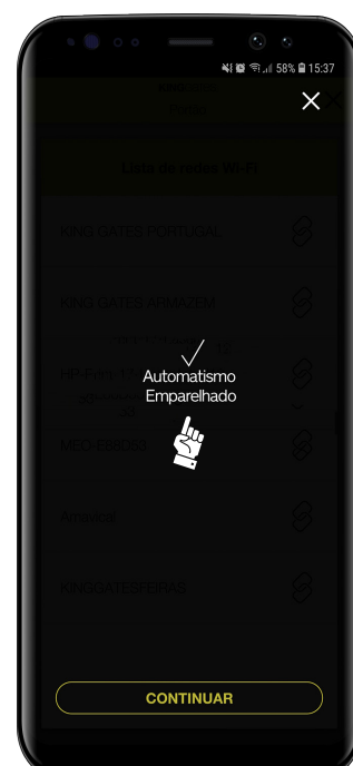
4- O automatismo encontra-se emparelhado