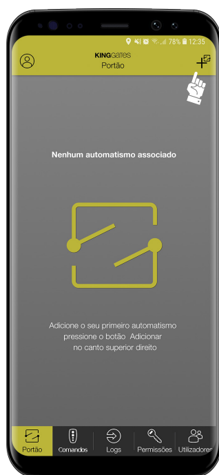
1- Clique no icon “+”

Nesta secção, está presente uma explicação de como se adquire um acesso a partir de um código Q.R. Para esta operação, o novo utilizador tem que fazer o download da aplicação CLAVIS e efetuar o registo.