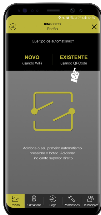
2- Clique em “existente”