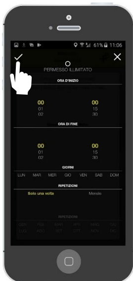
Scegliere i limiti temporali