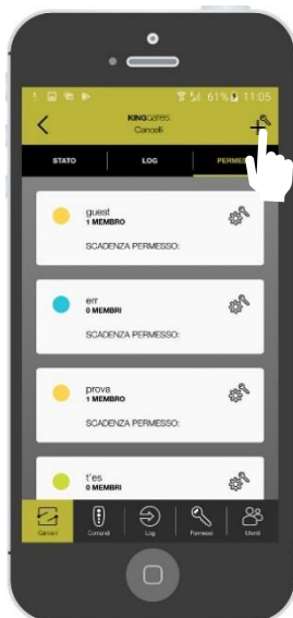
Selezionare il simbolo «+»