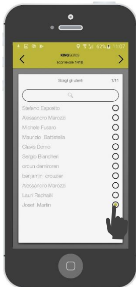
Scegliere le persone a cui inviare il permesso