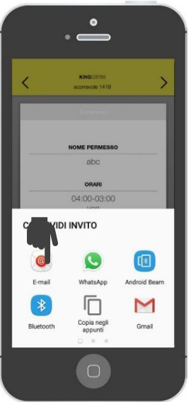
L'invito può essere condiviso via mail, whatsapp, message, etc. Le persone invitate riceveranno il link e successivamente selezioneranno la APP ed il link per ottenere il permesso