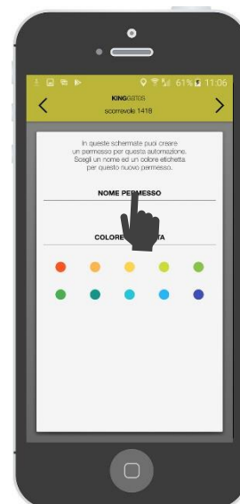
Dare un nome e selezionare un colore identificativo poi avanzare « > »